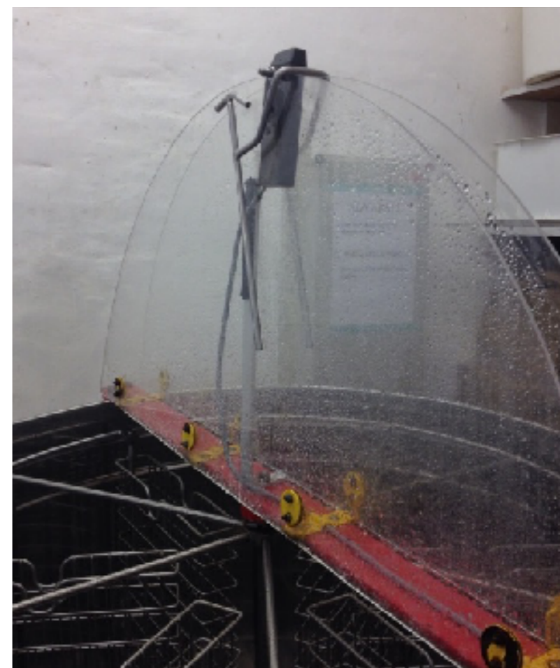
Opslåede halv-låg, holdt på plads af spandekrog