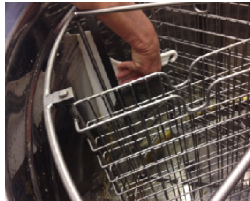
Honning skrubes ned ad slyngens sider